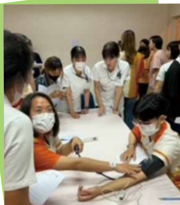
▲ナレスワン大学の学生さんとの交流

日本はシステムの中で様々なことを行う傾向にあり、少しかたい部分があります。そんな中でタイでの研修ではお国柄もありますが、寛容でやさしい部分が多くありとても貴重な交流体験ができました。