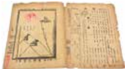
定期刊行物「丙寅」 現存する号がほぼない 貴重な資料の1つです

終戦前後、入手が難しかったモンゴル語・漢語・ロシア語等で書かれた稀少な資料も多数含まれています。