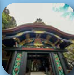
▲竹生島の宝厳寺 (長浜市)