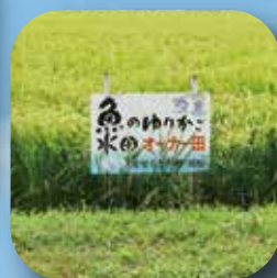
▲魚のゆりかご水田 (野洲市)