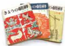
定期刊行物「きょうの朝鮮」

朴文庫の資料群は膨大な量であり、整理を終えた資料から閲覧できます。一年を通して多くの研究者が資料を求めて来館されます。