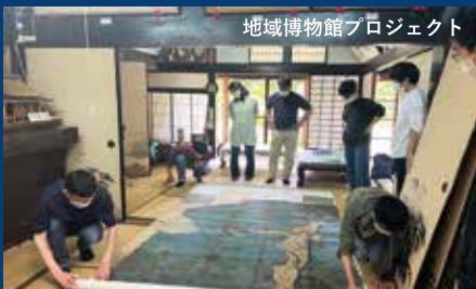
地域博物館プロジェクト

2004（平成16）年にスタートした近江楽座は、学部や学科・研究室などの垣根を越えて集まった多様な県大生が一体となり、地域貢献活動を行っています。審査を経て採択されたプロジェクトには経費が助成され、まちづくりや地域おこしなどで活躍しています。滋賀県内の様々な地域を活動フィールドとし、学生の学びと貢献活動がひとつになったプロジェクトです。