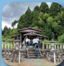
▲志子淵神社 (高島市)